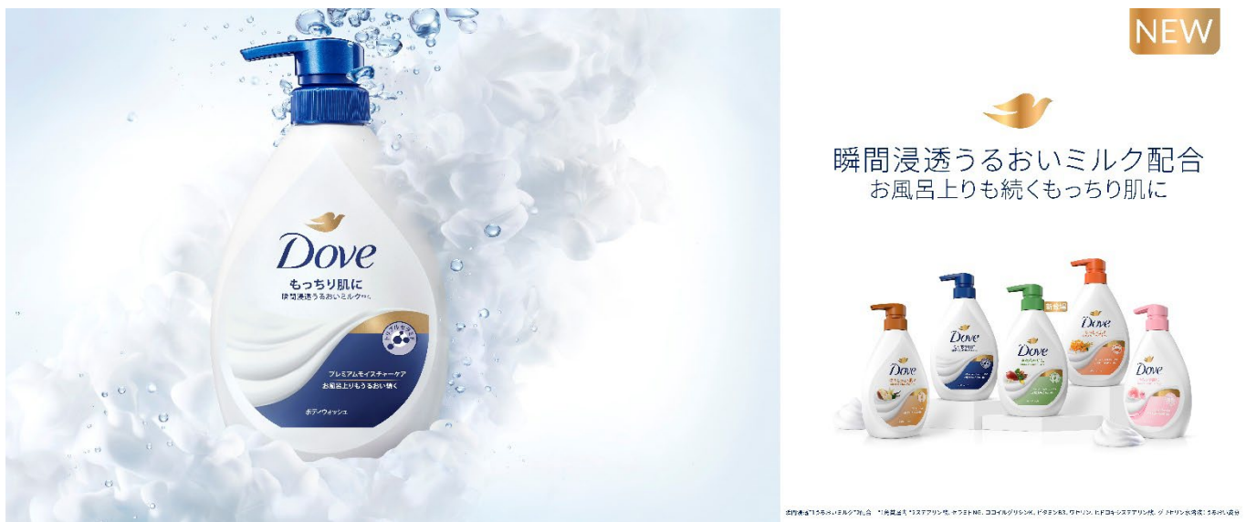
瞬間浸透 ※1 うるおいミルク ※2 配合 *1 角質層内 *2 ステアリン酸、セラミド NG、ココイルグリシン K、ビタミン B3、ワセリン、ヒドロキシステアリン酸、グリセリン水溶液：うるおい成分

ユニリーバ・ジャパン・カスタマー・マーケティング株式会社（本社：東京都目黒区、代表取締役 社長：ジョイ・ホー）が展開するパーソナルビューティーケアブランド「ダヴ」は、長年愛されている「ダヴ ボディウォッシュ」シリーズを3年ぶりに大型改良して新発売。瞬間浸透 ※1 うるおいミルクを新たに配合し、お風呂上りもうるおいが続く処方にリニューアルいたします。また、オーガニックホホバオイル ※3 を配合した「ホホバオイル&サンダルウッド」が新たにラインナップに加わり、2023年10月2日（月）より全国で順次発売を開始します。